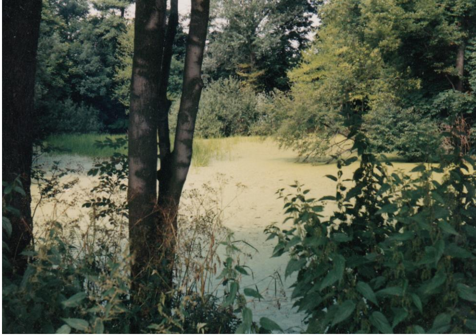
A – Rybník Pod Kozlovem focený roku 1996 – je zároveň levým pramenem potoka Blinky.