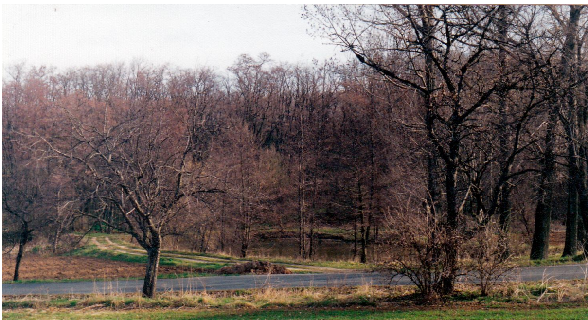
C - S potokem Blinka se rozloučíme na rybníku za Voděrady, při cestě do Libodřic. Pamětníci vzpomínají jak se zde dříve koupávali. Vždyť už na jaře roku 1945 byly vypracovány plány na tomto majetku místního Sokola. „Rybník tento byl již na podzim vypuštěn a ryby z něj vyloveny.“ Snímek je pořízen v roce 2004.