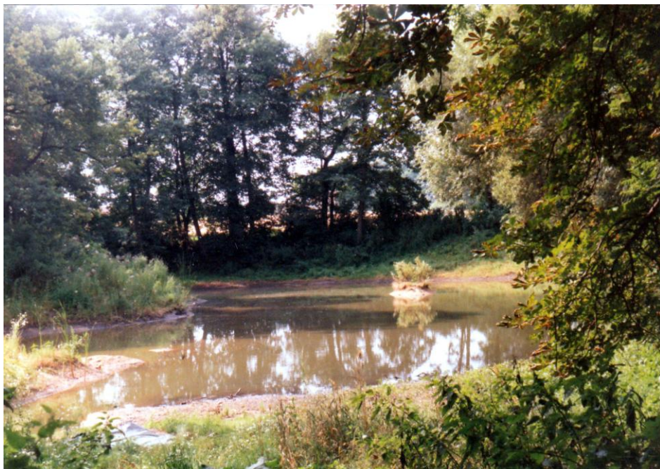
V roce 2004 Dočkalovými renovovaný rybník.