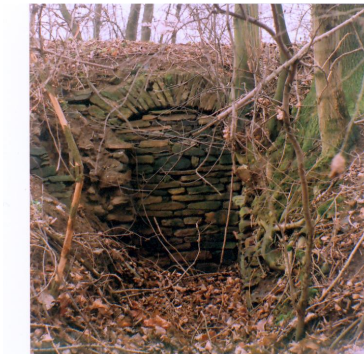
B – Hráz se zздěnou propustí rybníka Pod Kozlovem. Co pamatuji, vždy zde vody bylo poskromnu. Foto 2007.