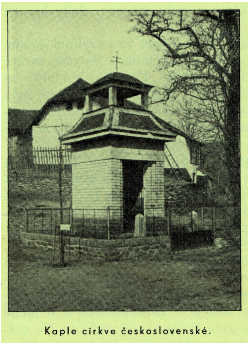
Kaple církve československé.

Fotografie pořízená nedlouho poté, kdy byly vysázeny pamětní lípy.