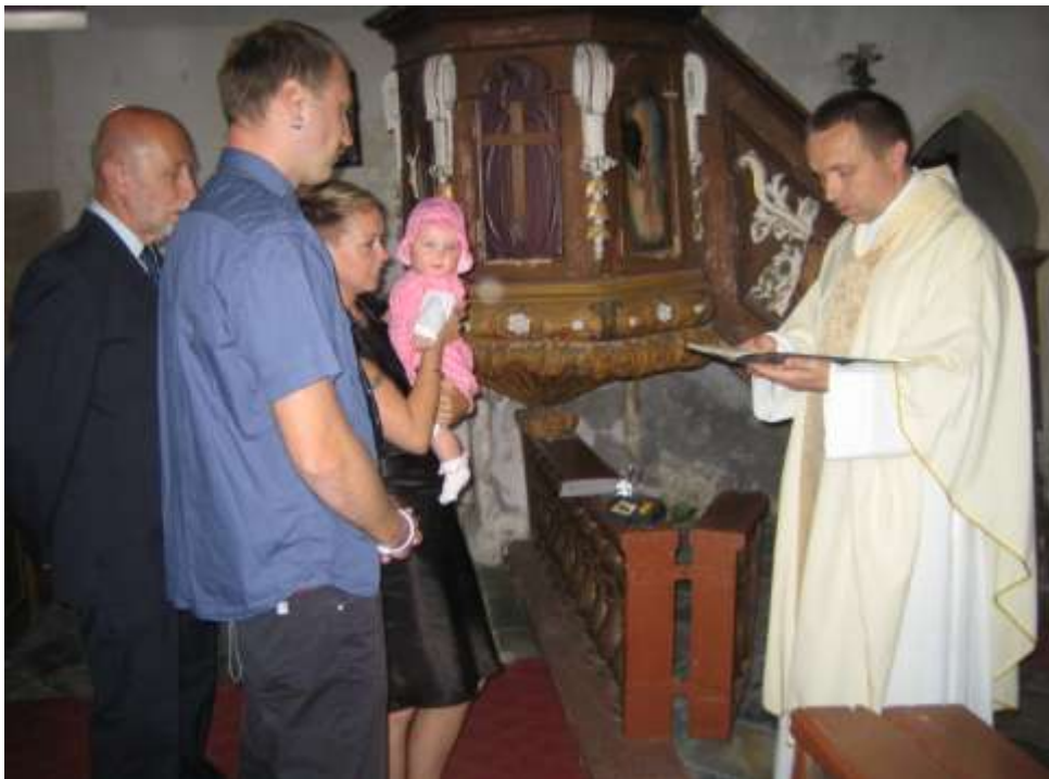
V kostele se konají několikrát do roka mše svaté. V létě roku 2011 zde byla křtěna Rozálie Kletečková.