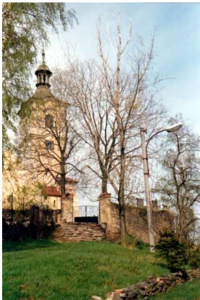
Moje první fotografie kostela pořízená v r.1992.

Nakonec přišel rok 1945 a s ním i šťastné shledání z vráceným zvonem Gotthard. I zvon z r.1932 se údajně našel v Hamburku a byl nabídnut k vrácení. Tehdy zřejmě nebyl dostatek zájmu, či šlo o finanční problémy..... Bůh ví ?