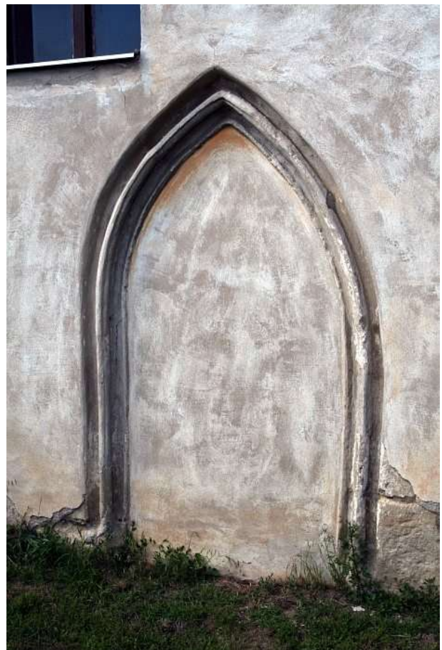
V jižní stěně lodi kostela se zachoval zadržný gotický vstupní portál s lomeným záklenkem.