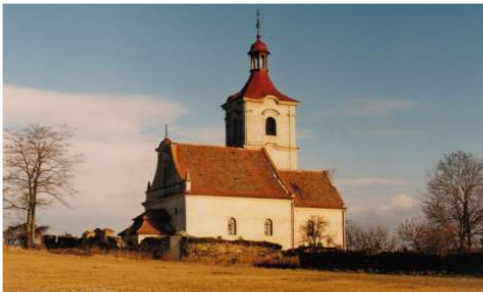
Leden 1999 – konečná podoba kostela s vyměněnou věžní střechou i s doškami, takto vypadala v době svého vzniku v r.1759.