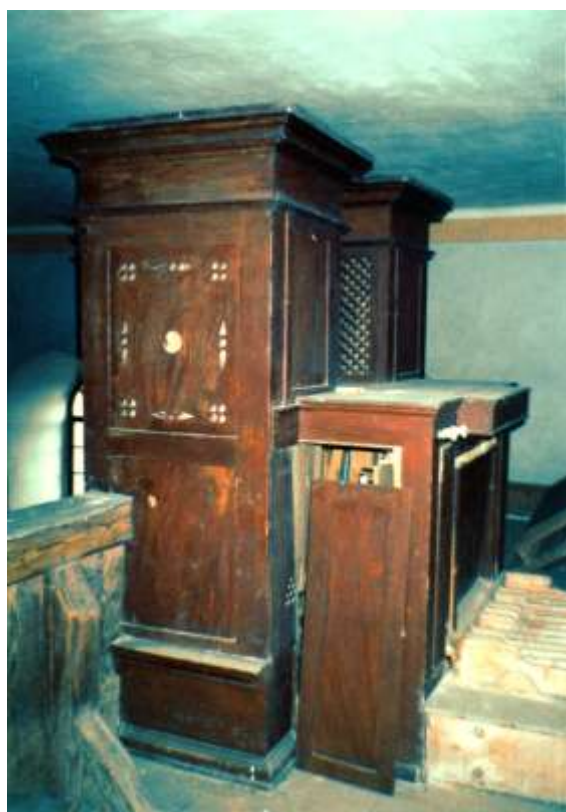
V srpnu roku 1870 v kostele postaveny nové varhany od Ant.Molza, stavitele varhan v Kutné Hoře, za částku 650 zl. - uhrazených z důchodů kostelních. R.1917 varhany přišly o několik pedálových píšťal pro válečné účely. Dnes jsou varhany nefunkční.