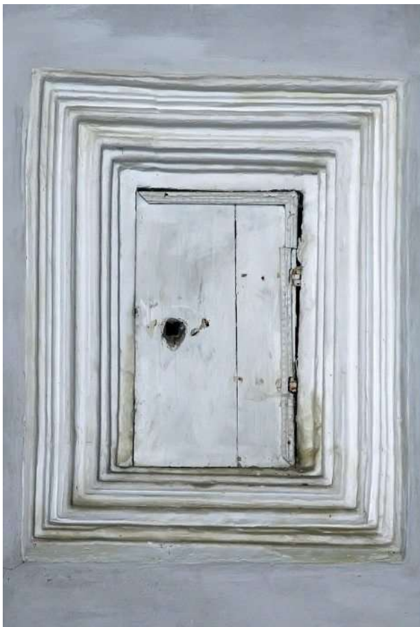
V severní stěně presbytáře je obdélné gotické sanktuárium – sem má přístup jen kněz a slouží k ukládání liturgických nádob.