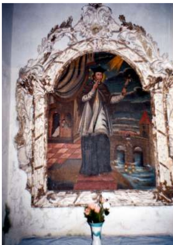
Vlevo od hl.oltáře oltář sv.Jana Nepomuckého zpodobněného na obraze zobrazujícího Nevyzrazení zpovědního tajemství a zchození z Karlova mostu do Vltavy.