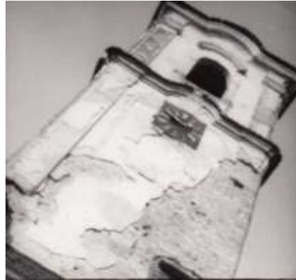
Foto z r.1958, jak je vidět, fasáda už naléhavě volá po opravě.