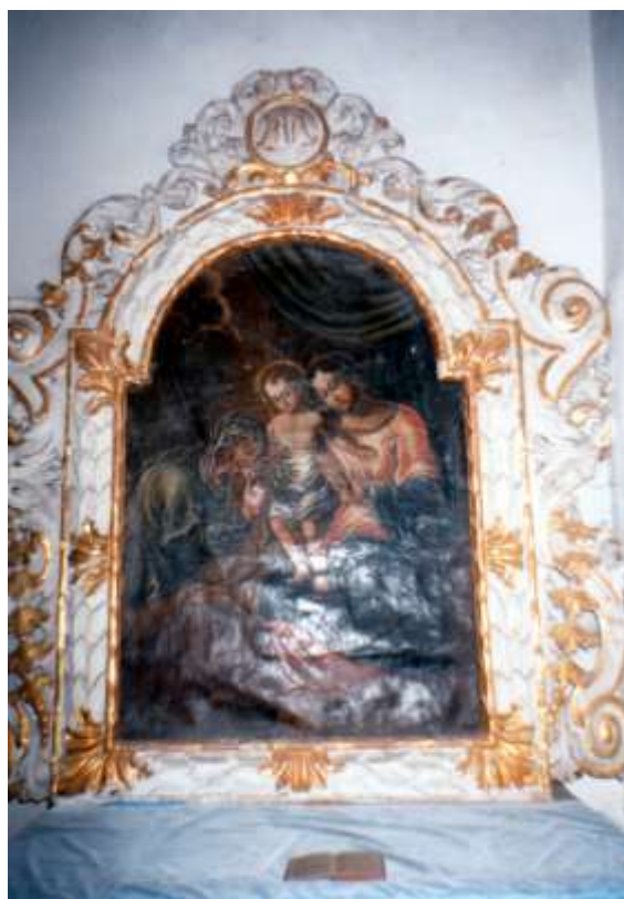
Po pravé straně oltář s obrazem znázorňující sv.Annu, Pannu Marii a Ježíška.