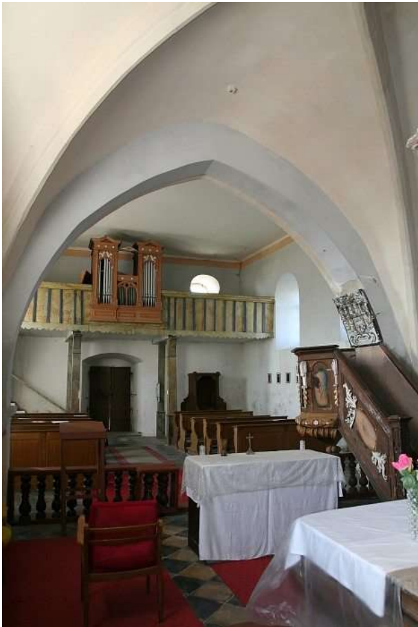
Pohled z kněžiště do lodi kostela, nahore na kruchtě jsou varhany.