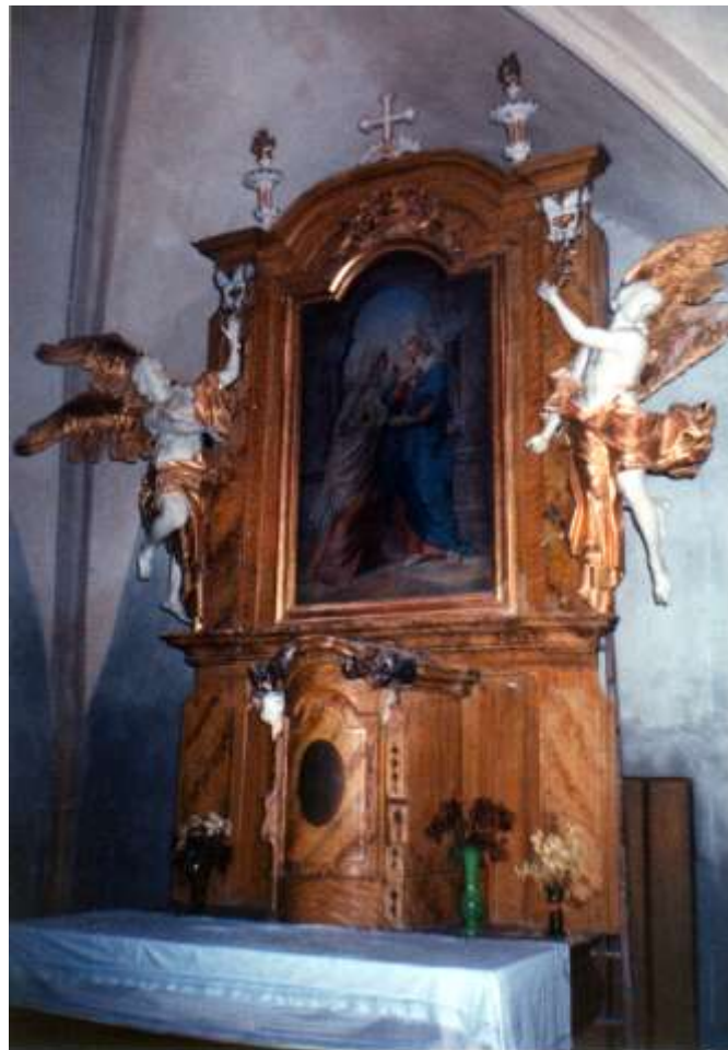
Hlavní rokokový rámový oltář z r.1760, opravený v létě r.1869, ještě na poprsnici kruchty s kvalitními bustami sv.Jáchyma a sv.Anny z 40.let 18.stol. od neznámého autora. V některých pramenech se uvádí, že pocházely z braunova okruhu (Fr.Adámek?), ale asi pocházely z kutnohorských dílen období baroka – původně se nejspíš jednalo o oltářní sochy, druhotně ořezané do podoby bust.