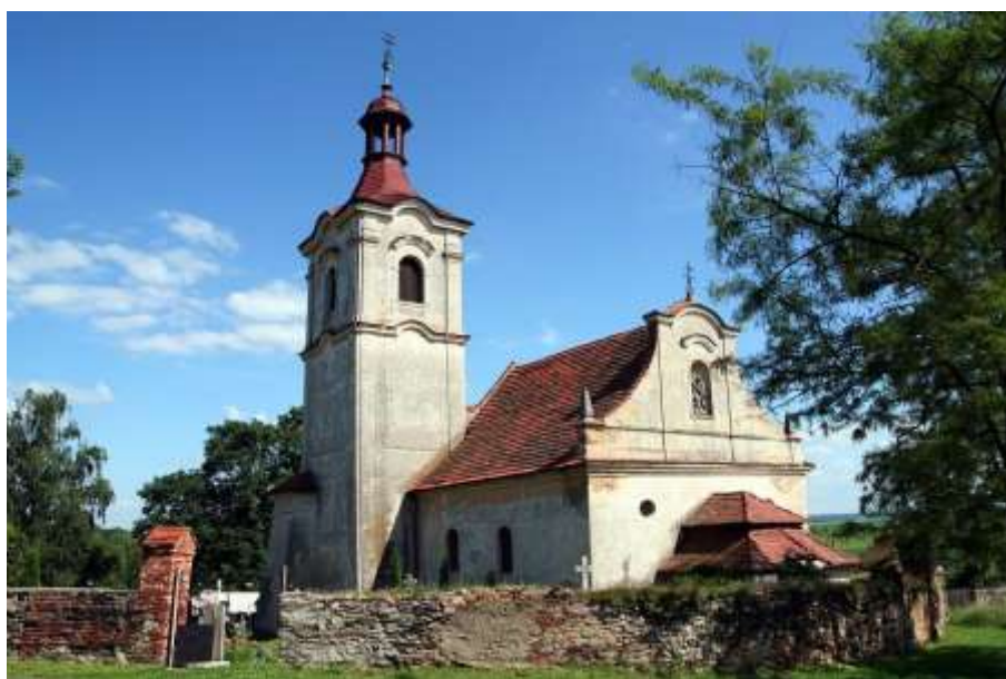
Na fotografii severní kostelní věž, západní loď a před ní barokní předsíň.