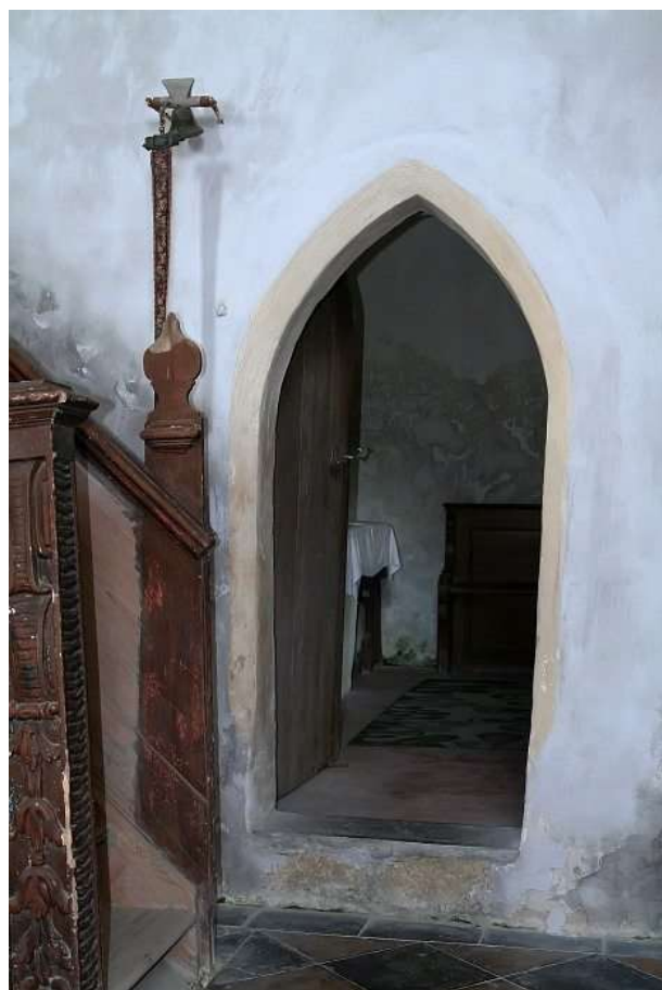
Pohled z presbytáře do sakristie, kam vede gotický hrotitý portál. Sakristie, nacházející se v přízemí kostelní věže- zřejmě pozůstatek původního románského kostela.