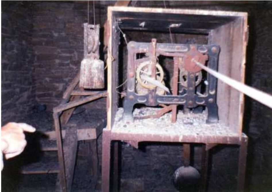
Ve věži o patro níž nalezneme stroj věžních hodin s kyvadlem a závažím od firmy „Adámek-Čáslav“. Dopředu běží unašecí hřídel „ručiček“. Naměřené rozměry rámu jsou 66 x 69 cm. Hodiny už dávno neukazují čas.