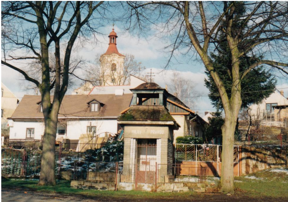
Na fotografii pořízené roku 1995 evangelická kaple ještě se zahrádkou.