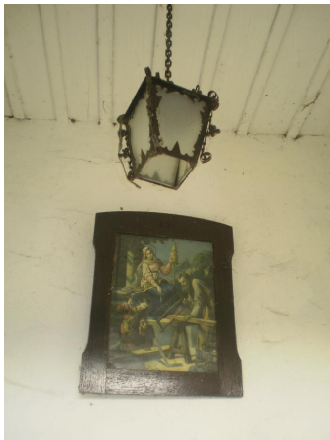
Vnitřní záběr kaple z roku 2011.