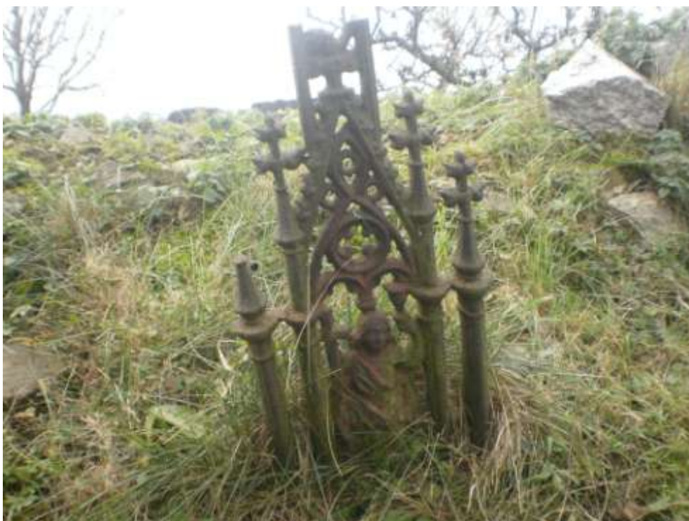
Další spodní část zřejmě kovového kříže – foto 2011.