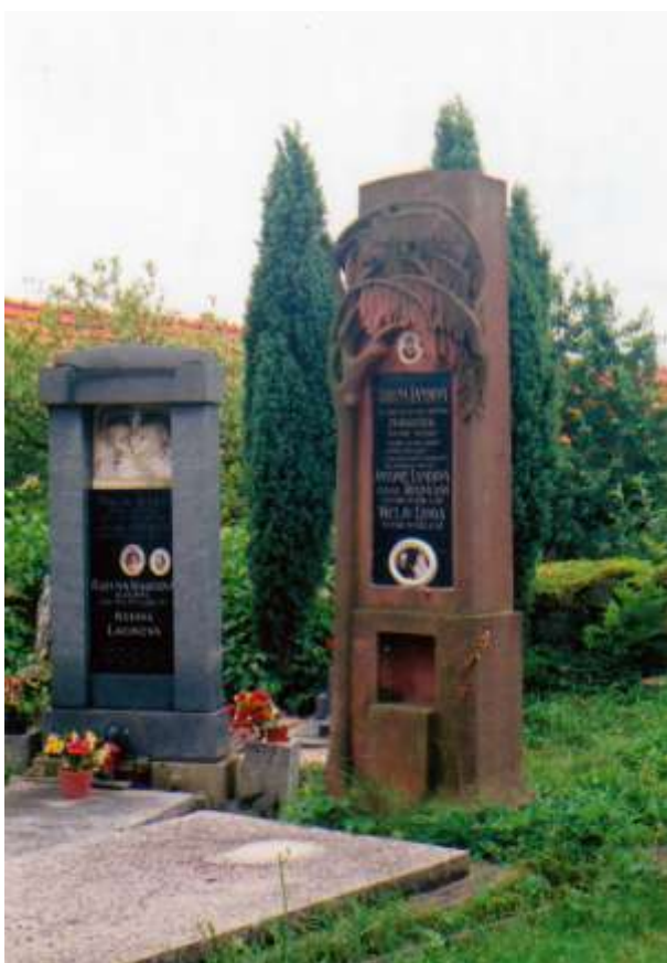
Hrob rodiny Sekrtovi, Lacinovi a Landovi z Voděrad. Fotografováno v roce 2007.