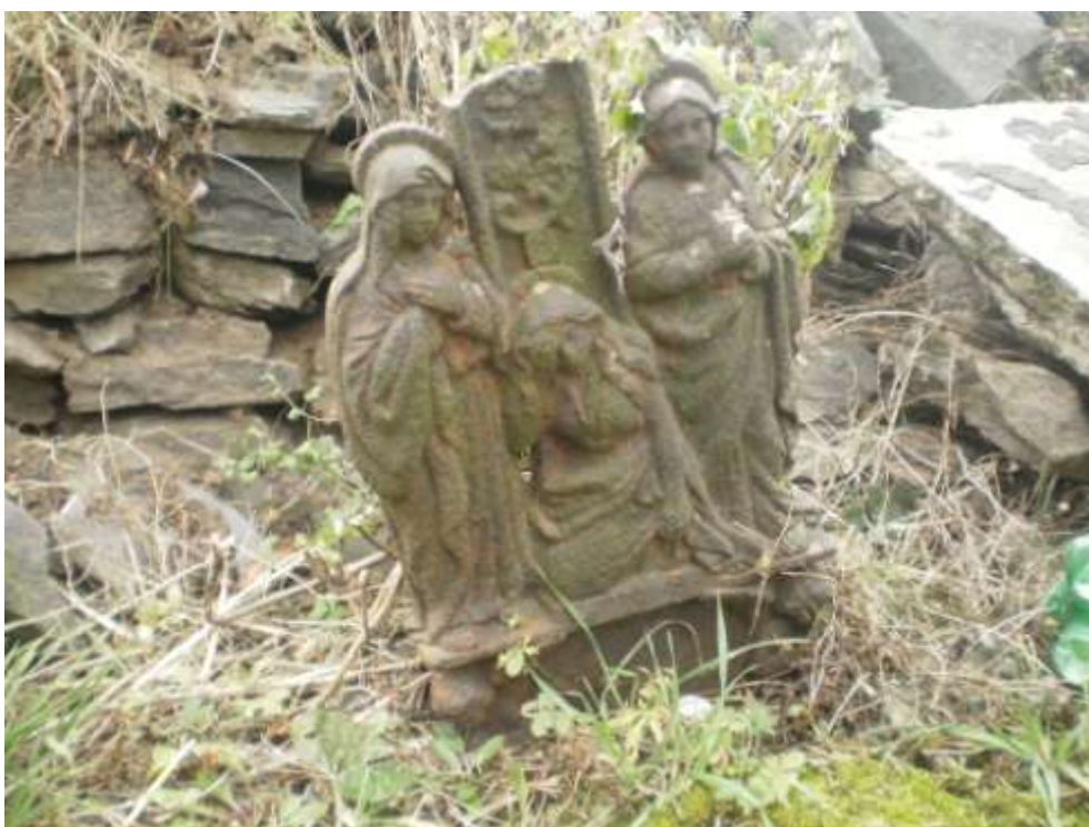
Zřejmě zbytek železného kříže – foceno roku 2011.