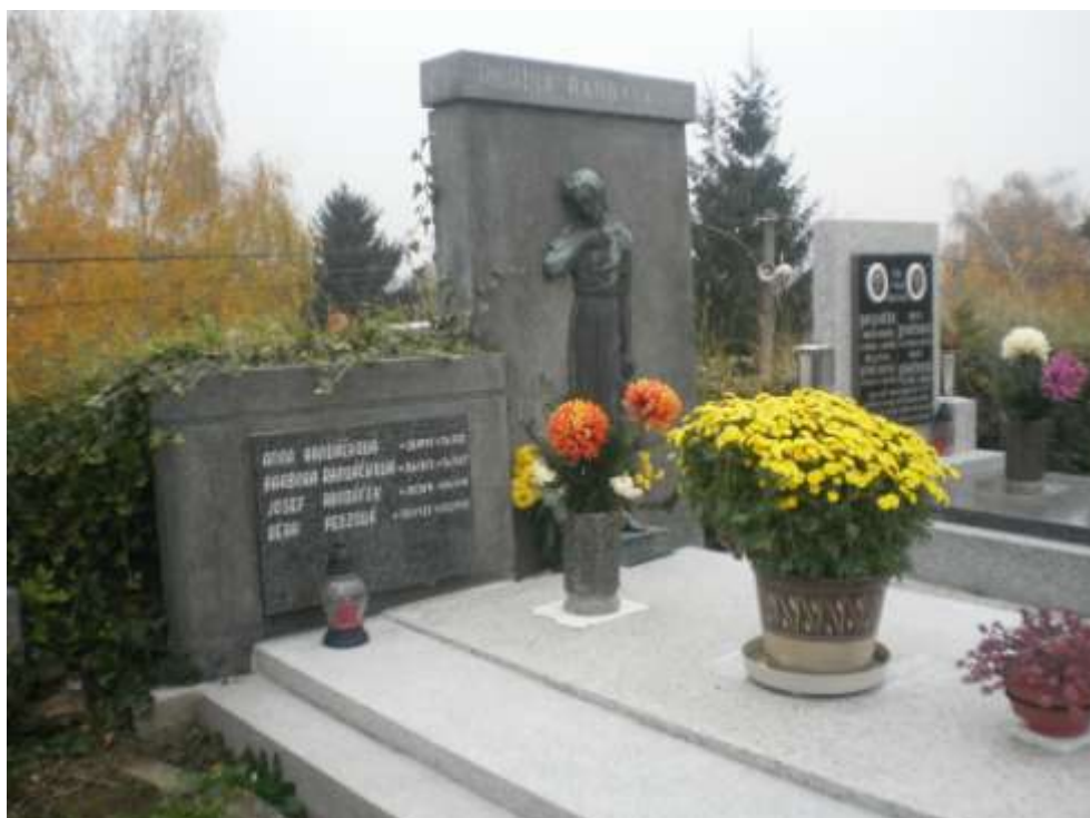
Na fotografii z r.2011 hrobka rodiny Randáčkoví. Zde odpočívá i hostinský z č.p.15, kde šenkoval. Zemřel 5.4.1944 ve věku 52 let.