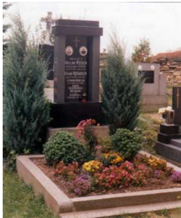
V tomto hrobě jsou pochováni Koškovi, Neumanovi, Kubelkovi a Strakovi. Foto 2004.