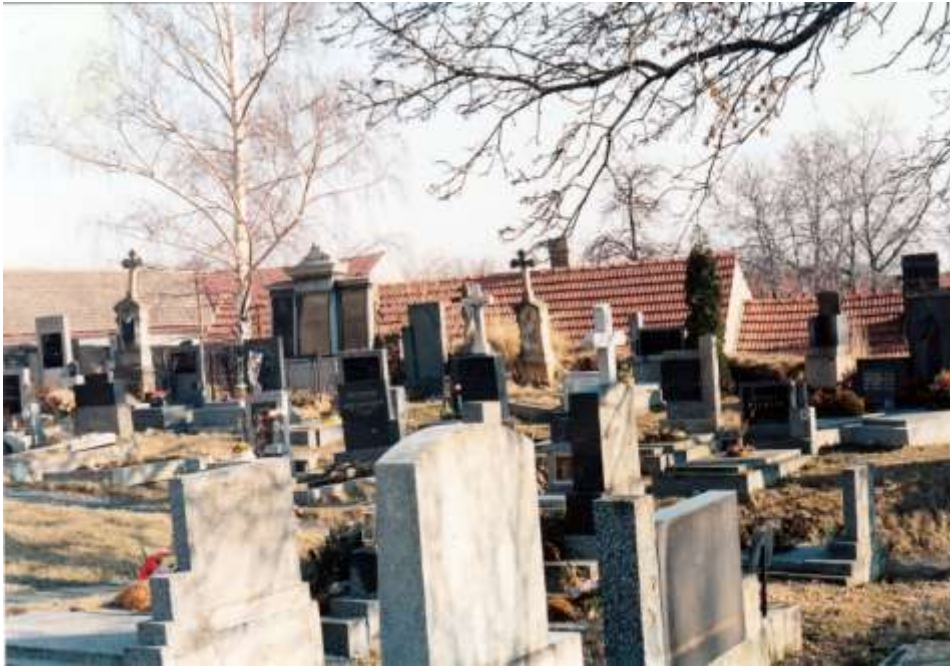
Severní strana hřbitova focená r.1996.