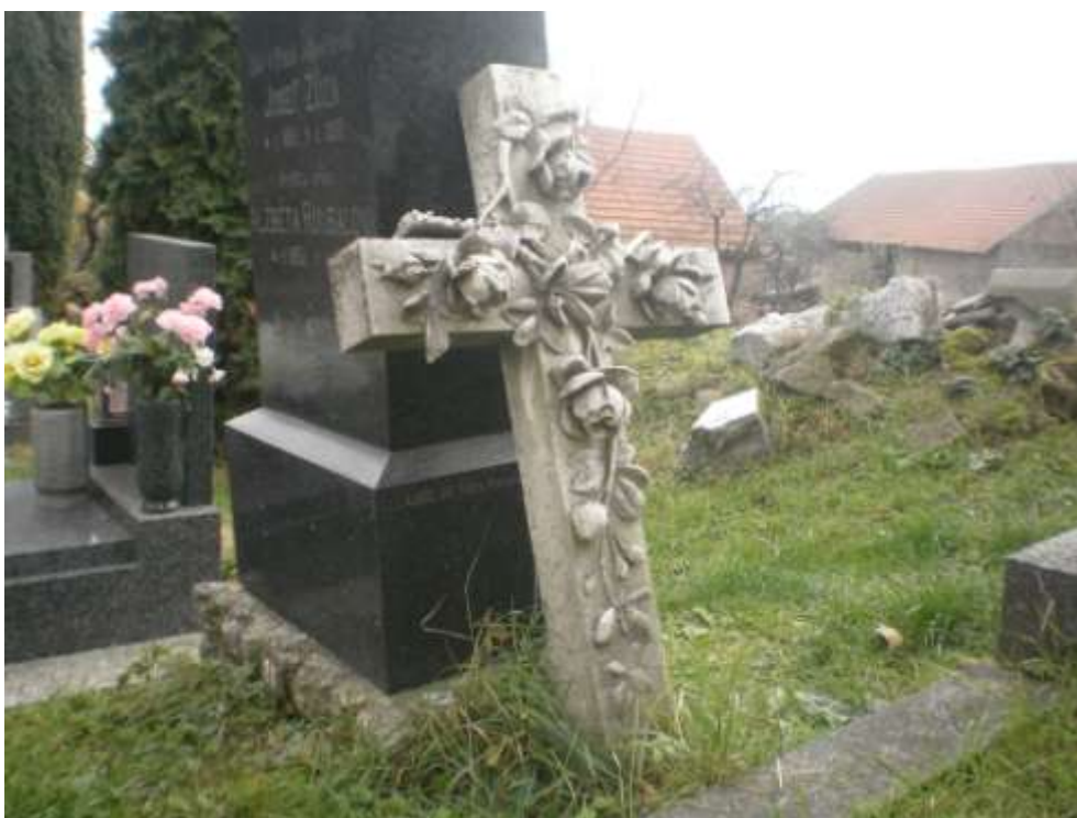
Kamenný kříž volně položený – fotografie z roku 2011.