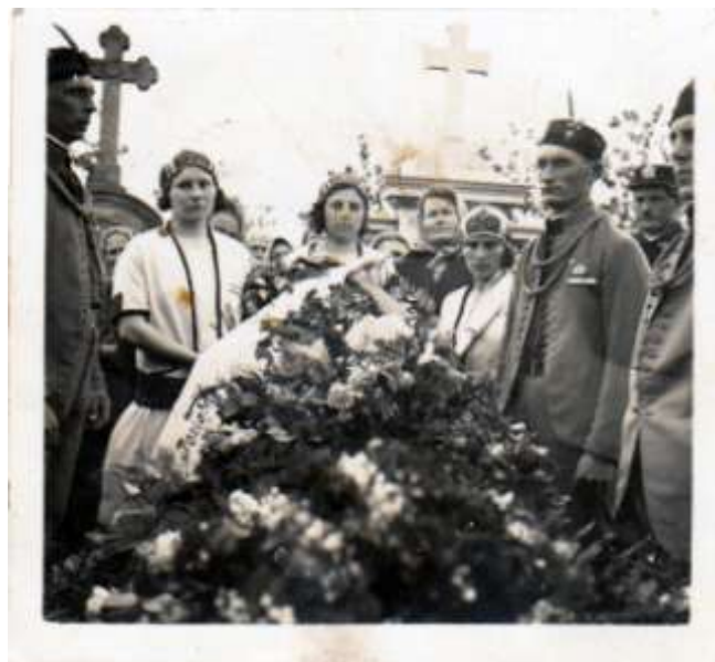
Na fotografii někdy z 20.let 19.stol. Pohřeb za přítomnosti Sokolů a hasičů. Fotografováno na severní straně hřbitova.

A nyní se projdeme po hřbitově, určitě nás ledasco zaujme :