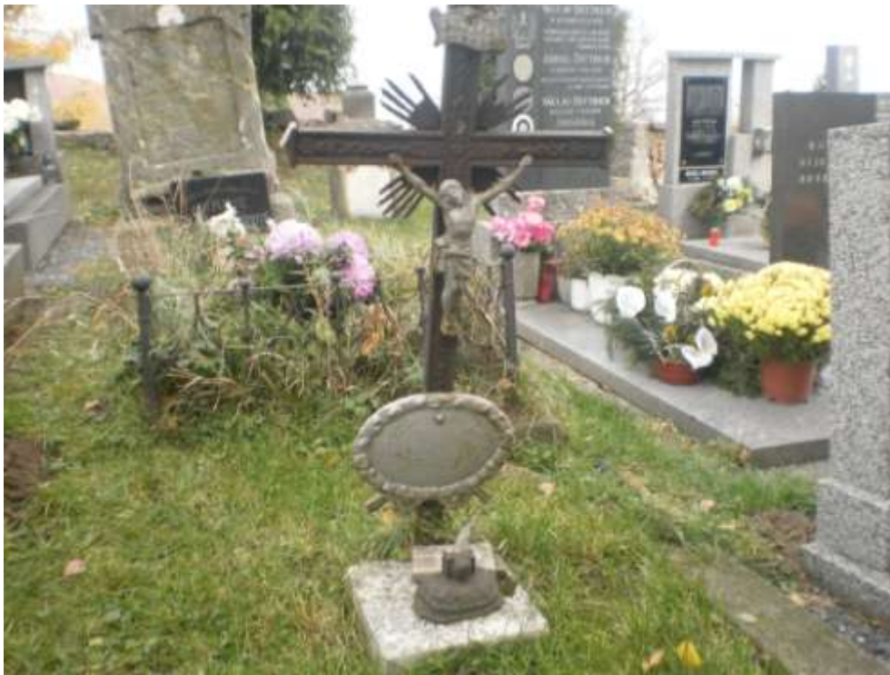
Další horní část kovového kříže zabodnutá do země – foto 2011.