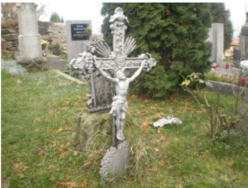
Tentokrát jen horní část kovového kříže – fotografie z r.2011.