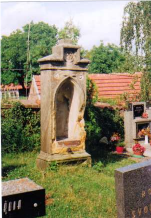
Foto náhrobku bez nápísů z roku 2008.