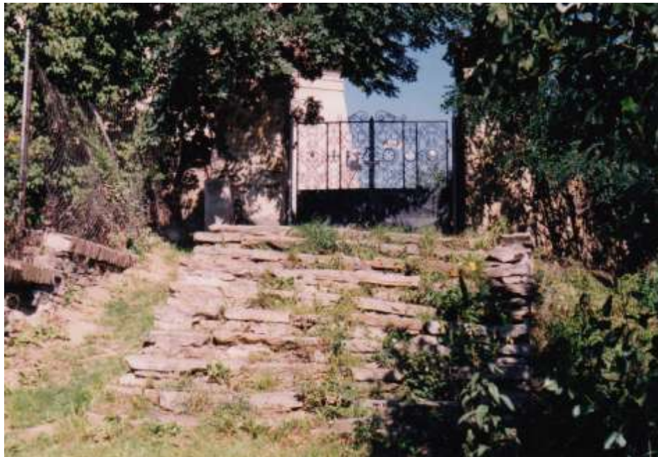
Jihovýchodní vstup na hřbitov focený roku 2000.

A tak potichu a s úctou k našim předkům vstupme na toto vznešené místo :