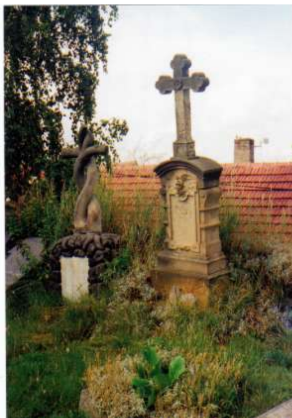
Hrob rodiny Votrubové a Cellerové. Foto 2007.