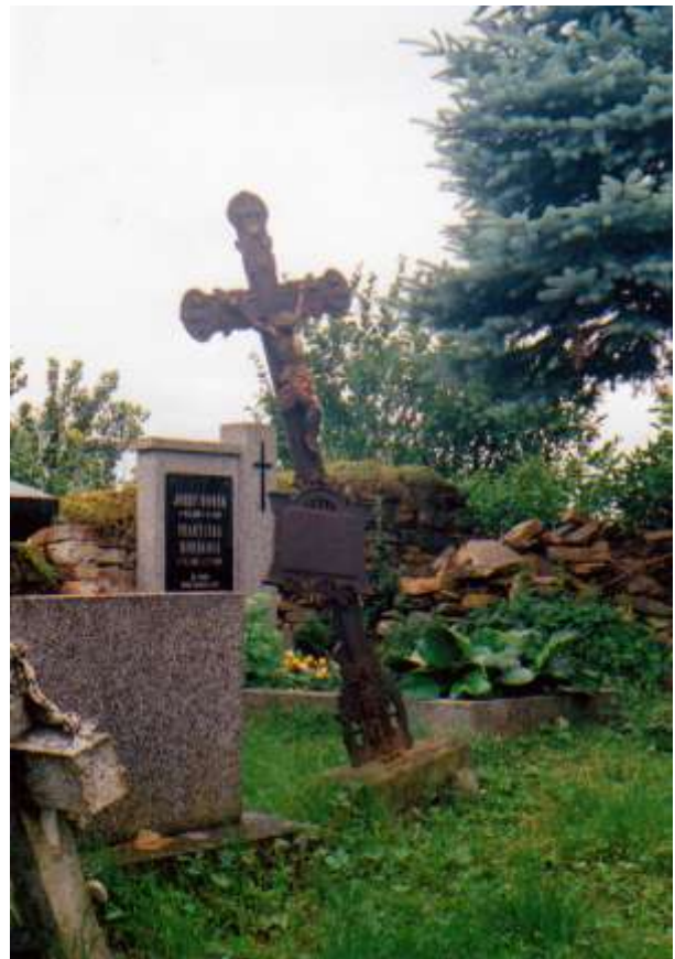
Železný kříž už také mlčí – foto 2007.