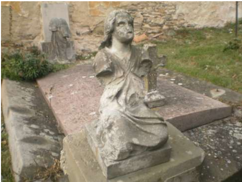
Tyto poničené sošky a kříž z kamene se už dlouhou dobu zdržují u panských