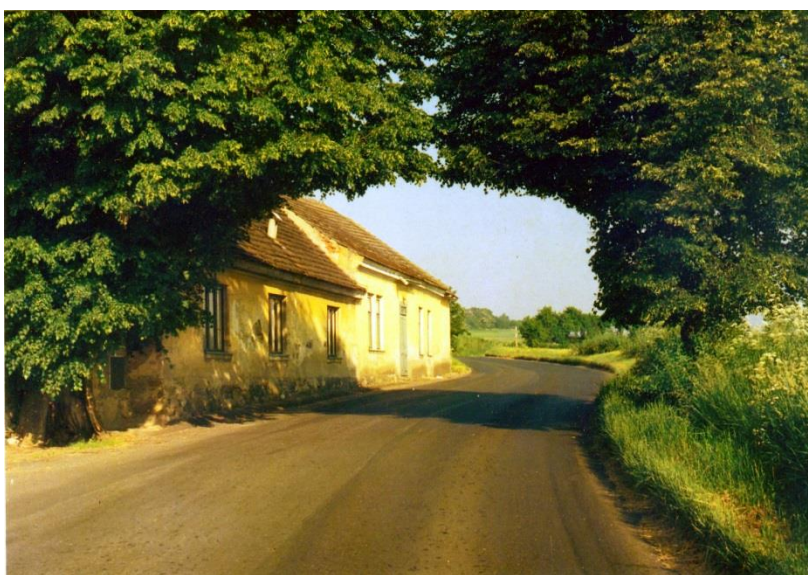
U bývalého hostince v domě č.15 stávala již dávno také letitá lípa (jeden čas se hospodě říkalo „hostinec Pod lípou“ – viz levá fotografie z roku 1958. Na pravém snímku společně s naproti přes silnici stojící lípou tvořila zde v r.2003 jakoby bránu ve směru jízdy z obce do Libodřic. Lípa tato, již dávno téměř dutá, byla pokácena v roce 2010.