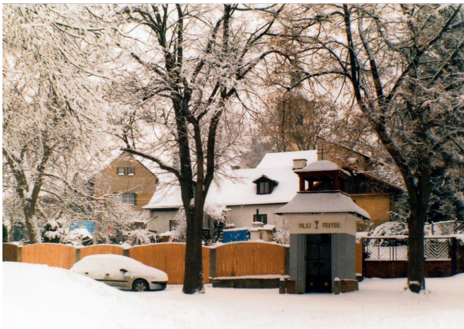
Na fotografii z roku 2006 už vzrostlé stromy, jen nevím který je který.